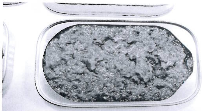
I samarbeid med Baader Norge er det testet ut en farsemaskin for restavskjær med godt resultat. Farsen kan produseres av bits and pieces, belly flaps og fileter med mindre kvalitetsfeil. Den kan f.eks. hermetiseres med salsa.