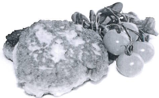
Bruksområdene for farsen er nesten ubegrenset. Her er det produsert fiskekaker av sildefarse.