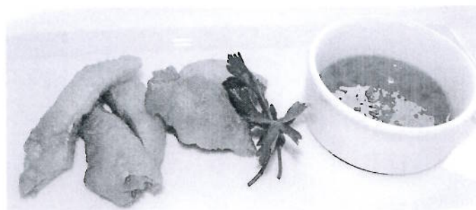
Frityrstekt belly flaps har en sprø konsistens og kan minne litt om baconcrisp. Smaken ligner mer på kylling enn sild.

Det tar tid å introdusere nye produkter. Belly flaps av laks er på enkelte områder sammenlignbart med belly flaps av sild. I laksenæringen begynte man å utnytte belly flaps på midten av 1990-tallet. I dag er belly flaps av laks et kommersielt produkt. Det sorteres i størrelser på 1-3 cm, 2-4 cm og 3-5 cm. De største størrelsene selges både med og uten skinn, og i ulike forpakninger. I 2011 ble det eksportert ca. 5.000 tonn belly flaps av laks fra Norge til en snittpris på 15 kr/kg. Det finnes flere sorteringer av produktet, og for de største (bredeste) belly flapsene er prisen klart høyest. Dette produktet eksporteres i hovedsak som «harasu» til det japanske sushimarkedet. Gjennom målrettet produktutvikling og langsiktig strategiarbeid bør man kunne få en tilsvarende utvikling for belly flaps fra sild.