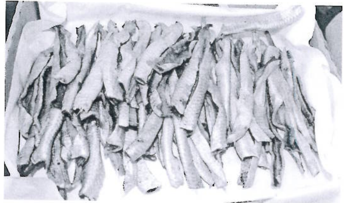
I dag går det meste av belly flaps og bits and pieces til produksjon av fiskemel og olje. I fremtiden kan man f.eks. røyke belly flapsen.