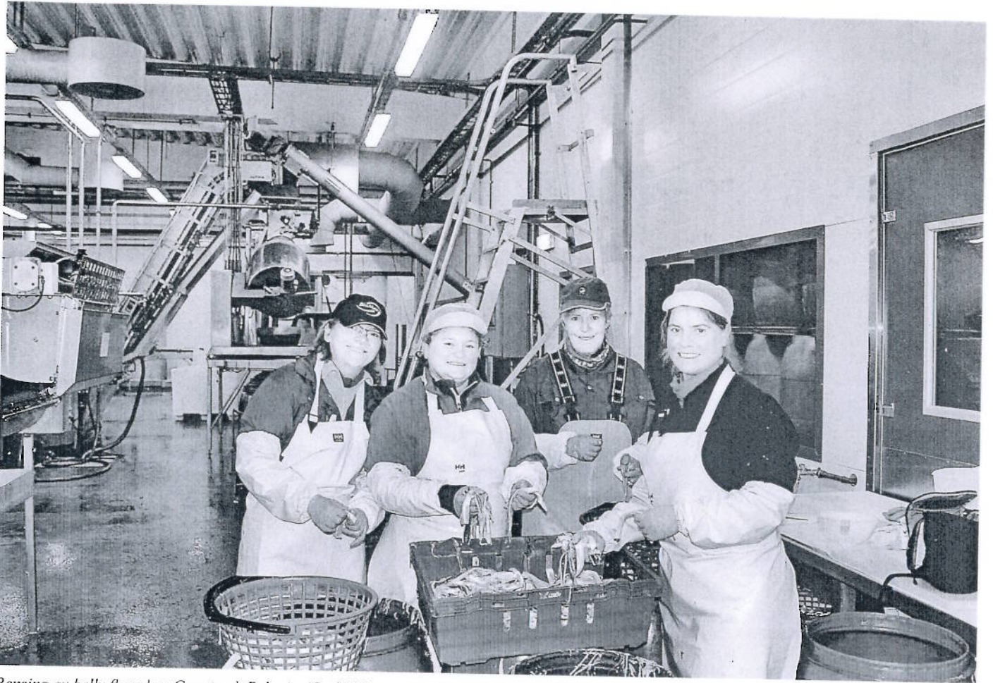
Rensing av belly flaps hos Grøntvedt Pelagic AS på Uthaug i Sør-Trøndelag. Selskapet er den største norske produsenten av marinerte sildeprodukter i tonne. I forbindelse med prosjektet for å utvikle konsumprodukter av restråstoffer fra nvg-sild ble det produsert naturlige, saltede og krydder- og eddikmarinerte buklist, samt naturlige og saltede bits and pieces.