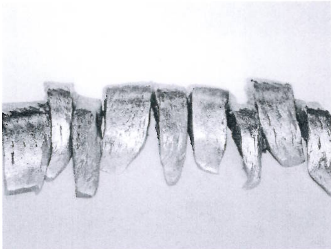
Grøntvedt Pelagic produserer biter av marinert sildefilet, hvor biter med feil fasong sorteres ut. Utsorterte biter kalles bits and pieces. Størrelsen på bitene varierer mellom 2 og 7 gram.